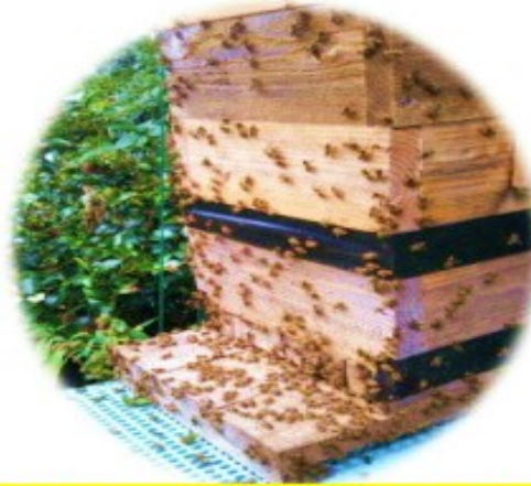
オオスズメバチが来ると右往左往するニホンミツバチ

通常オオスズメバチは畑の芋虫やアシナガ蜂の巣等の餌を確保しているが秋口は来年の子孫を残すため女王や牡バチを数多く育て、多くの食料が必要でミツバチを襲う。ミツバチが委縮しない様に早めの対策が必要です。