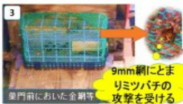
3 9mm網にとまりミツバチの攻撃を受ける 巣門前においた金網等