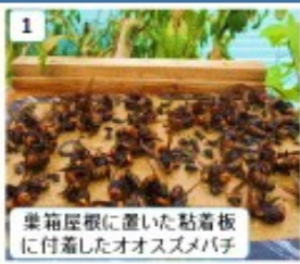
1 巣箱屋根に置いた粘着板に付着したオオスズメバチ