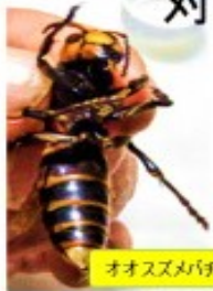
オオスズメバチ女王